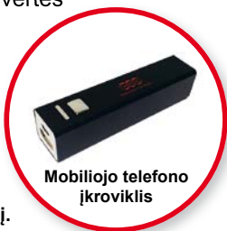
Mobiliojo telefono įkroviklis

Kiekvienas naujas NNN narys kaip sutikimo dovaną gauna puikų mobiliojo telefono įkroviklį.