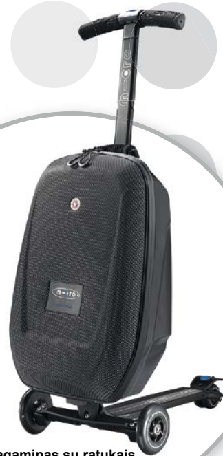
Lagaminas su ratukais

Daugiau informacijos apie narystę NNN, narystės privalumus ir registracijos blanką rasite internete adresu nnn.no