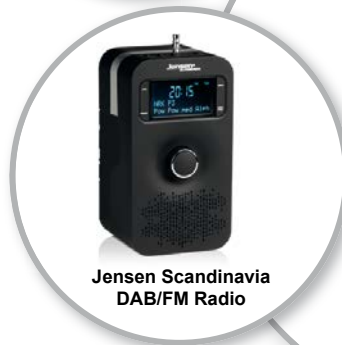
Jensen Scandinavia DAB/FM Radio