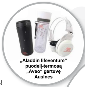
„Aladdin lifeventure“ puodelį-termosą „Aveo“ gertuvę Ausines