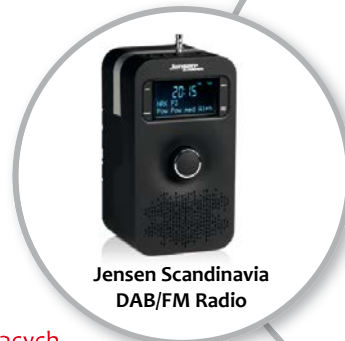
Jensen Scandinavia DAB/FM Radio