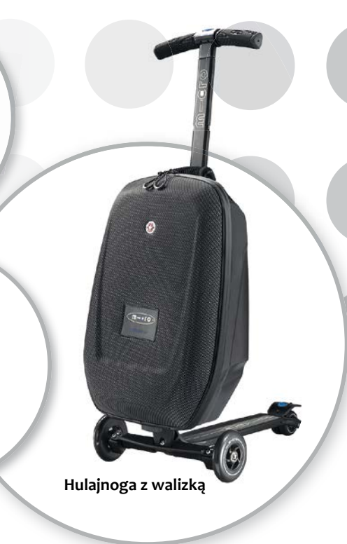
Hulajnoga z walizką

Więcej informacji na temat członkostwa w NNN i wynikających z niego korzyści oraz deklarację członkowską znajdziesz na stronie nnn.no