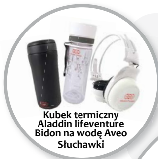
Kubek termiczny Aladdin lifeventure Bidon na wodę Aveo Słuchawki