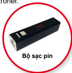
Bộ sạc pin

Tất cả mọi hội viên mới của NNN sẽ nhận được bộ sạc pin của điện thoại di động như món quà chào đón.