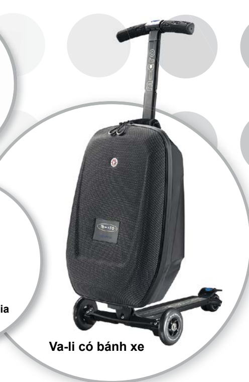
Va-li có bánh xe

Bạn có thể xem thêm thông tin về tư cách thành viên trong NNN, các lợi ích thành viên và mẫu đăng ký tại nnn.no