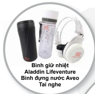
Bình giữ nhiệt Aladdin Lifeventure Bình đựng nước Aveo Tai nghe