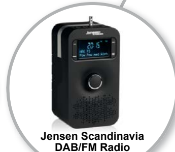
Jensen Scandinavia DAB/FM Radio