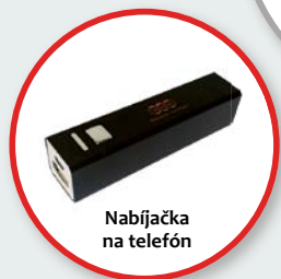
Nabíjačka na telefón