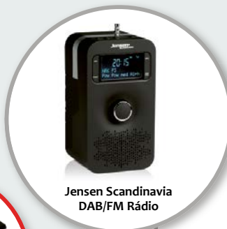
Jensen Scandinavia DAB/FM Rádio