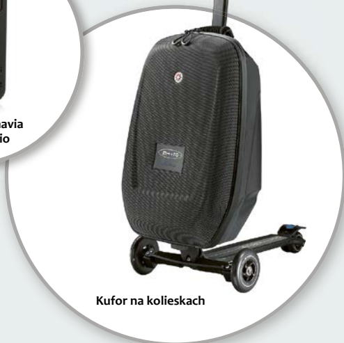
Kufor na kolieskach

Každý nový člen NNN dostane praktickú nabíjačku na telefón ako darček na privítanie.