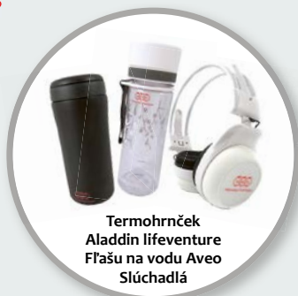
Termohrnček Aladdin lifeventure Fľašu na vodu Aveo Slúchadlá

Každý, kto do NNN privedie aspoň desať nových členov, dostane kombinovaný kufor na kolieskach a kolobežku v jednom v hodnote 3000 nórskych korún (323 €)..