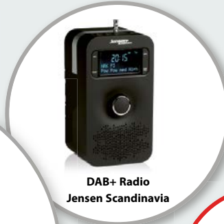
DAB+ Radio Jensen Scandinavia

کم از کم 10 نئے NNN ممبر بنوانے والے تمام افراد کو ایک کمبائنڈ ٹرالی کیس/سکوٹر ملے گا جس کی مالیت 3000 روپے ہے۔