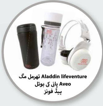
Aladdin lifeventure تھرمل مگ Aveo پانی کی بوتل ہیڈ فونز

ایک نیا NNN ممبر بنوانے والے تمام افراد ایک تھرملس، پانی کی بوتل یا ہیڈ فونز میں سے ایک چیز چن سکیں گے۔