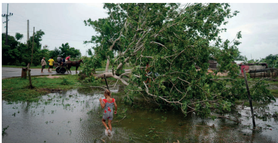
Lokalsamfunnet i La Coloma har plantet mangrovetrær til erstatning for dem som var blitt hugget ned. Dette forhindret at landsbyen ble fullstendig oversvømt da orkanen Ian traff provinsen i september 2022.

I et land med liten plass til offentlige protester, lager Ceprodeso bråk når for eksempel gruvekonsesjoner eller reiselivsprosjekter påvirker lokalsamfunnene negativt. Ceprodeso er også en del av det landsdekkende nettverket for folkelig miljøopplæring og miljøorganisasjonen Ecovida. I samarbeid med disse nettverkene kom Ceprodeso med innspill til naturressurs- og miljøloven som ble vedtatt i 2022.