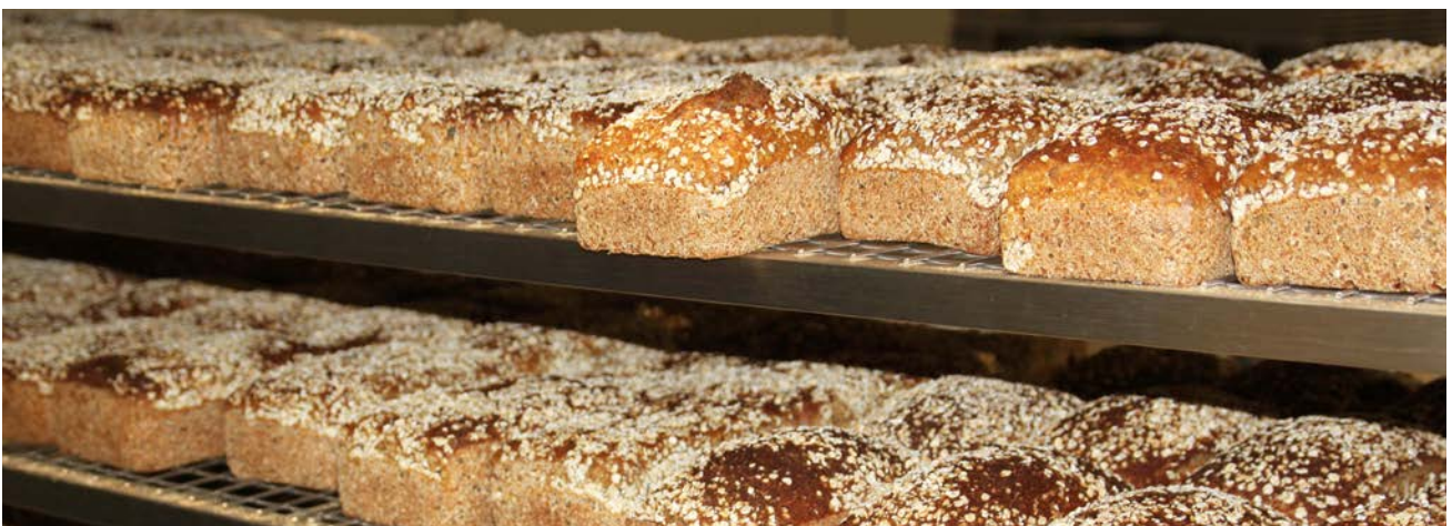
Nybakte brød hos Bakehuset Heba.

Både tidligere og nåværende fiskeriminister har hatt jevnlig dialogmøter med representanter fra næringen i løpet av året, og NNN har deltatt på de fleste av disse.