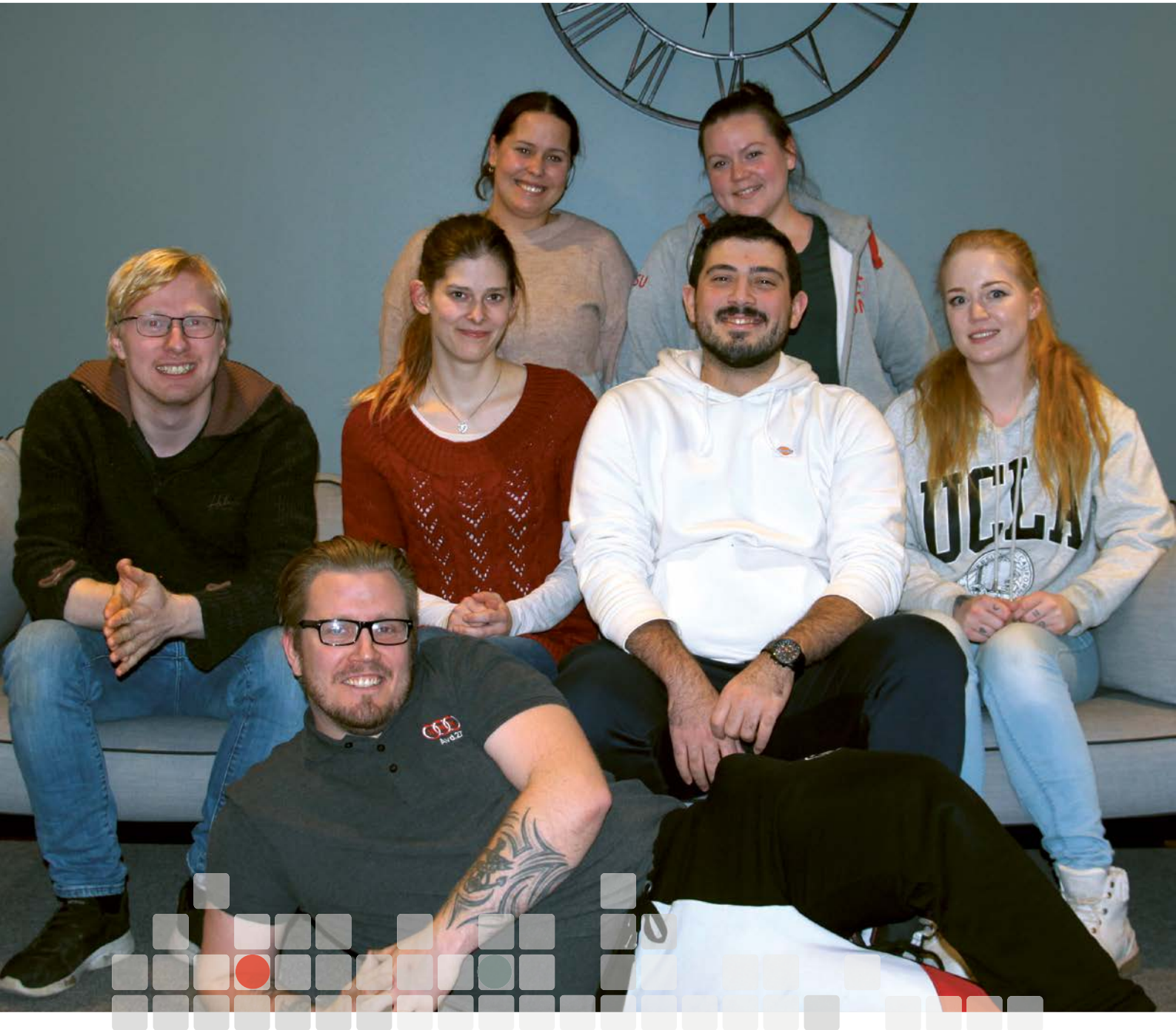
Det sentrale ungdomsutvalget (DSU).