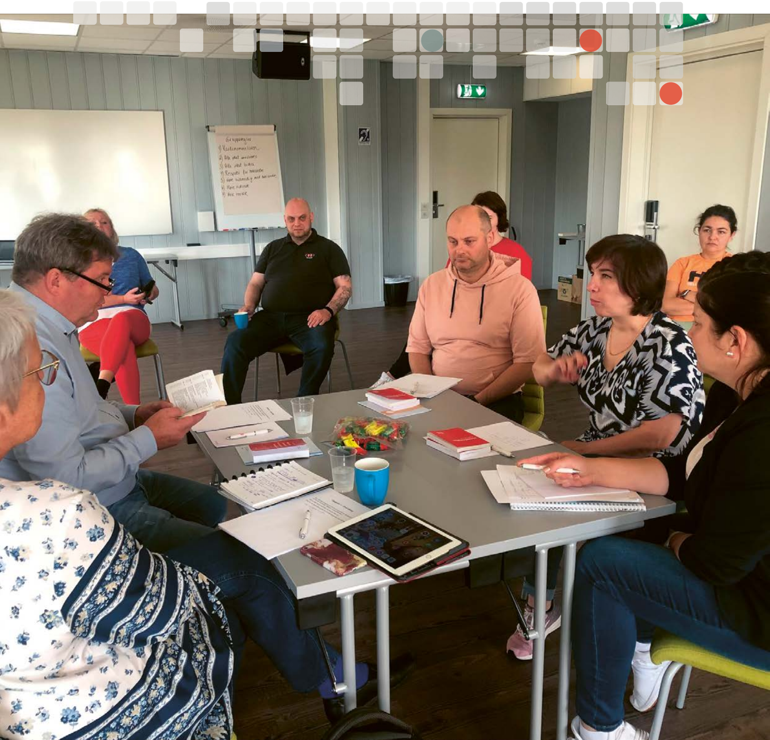
Kurs på Sørmarka.