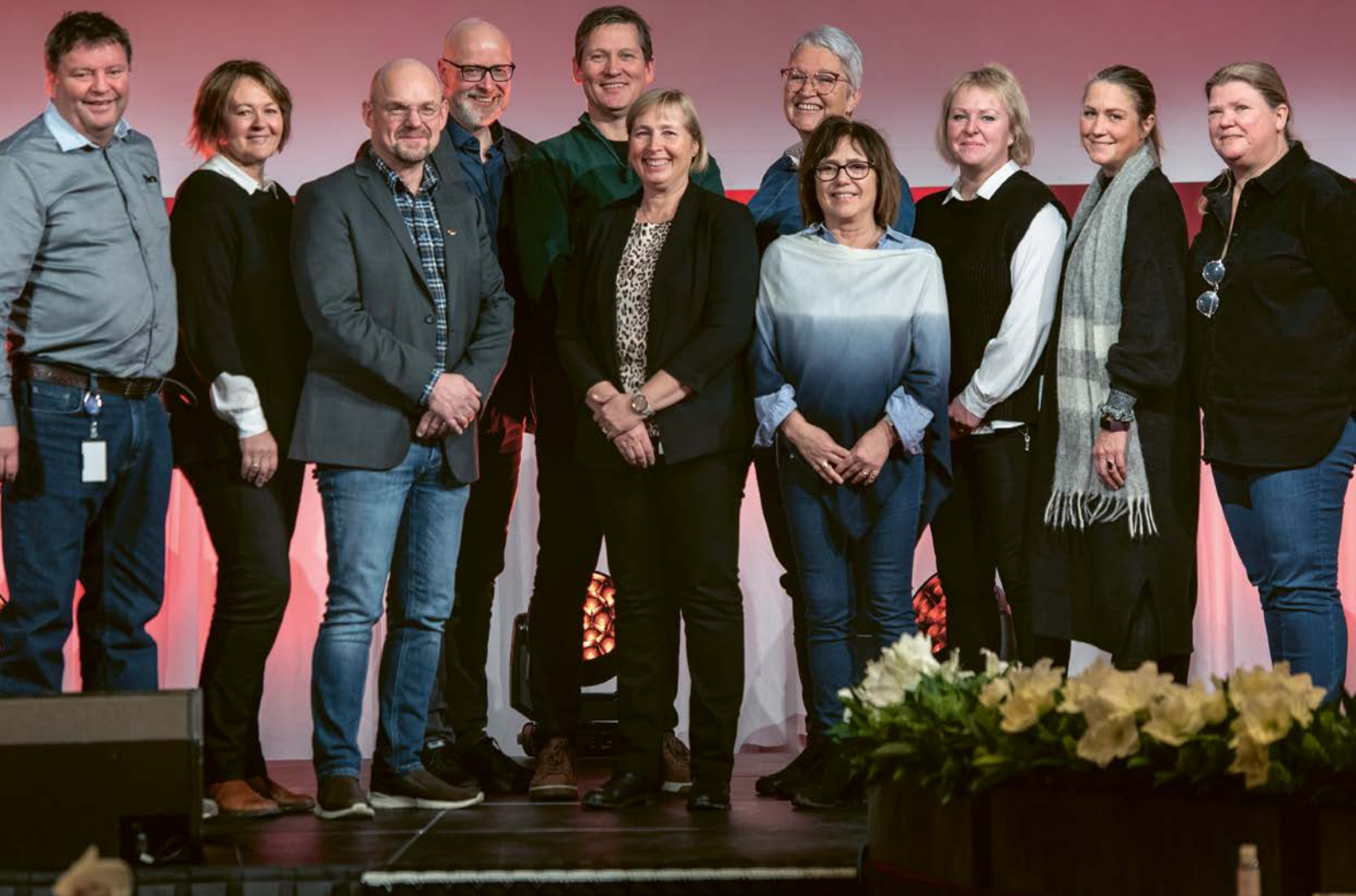
Nyvalgte og gjenvalgte forbundssekretærer og forbundsledelse på landsmøtet.