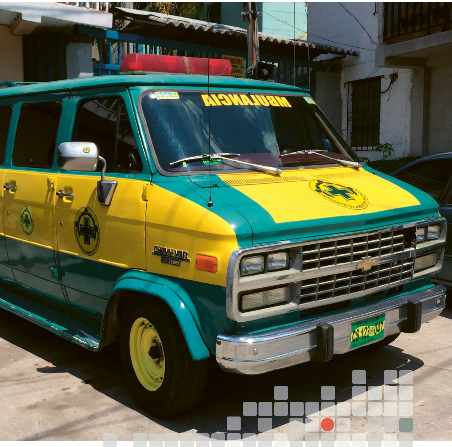
| Ambulanse i El Salvador – vårt samarbeid med Norsk Folkehjelp.