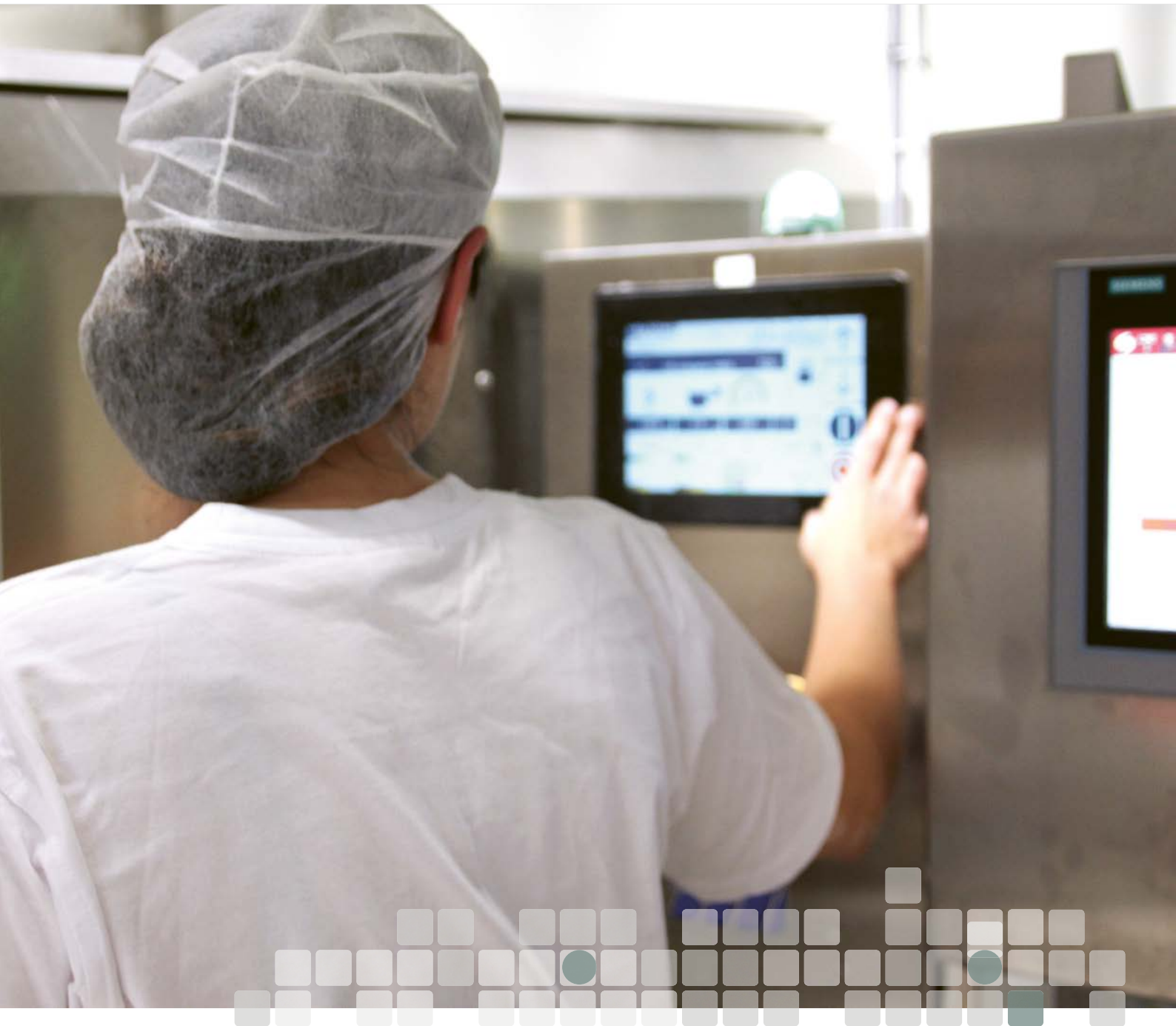
Maskinoperatør på Bakehuset.