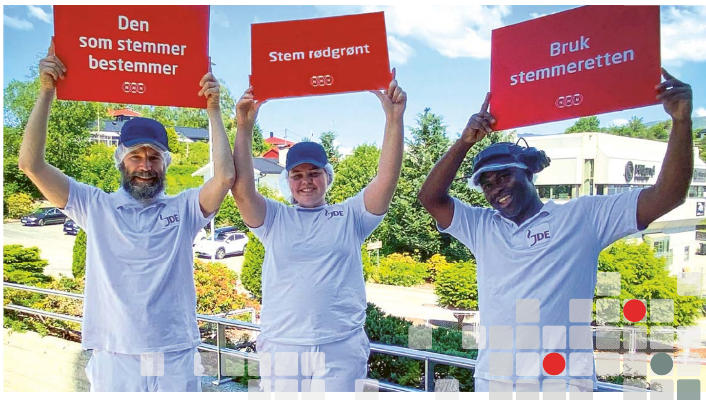
Valgkamp på Friele.

I november ble det gjennomført forhandlinger om revisjon av Hovedavtalen LO-NHO. Avtalen ble forlenget i fire nye år med kun små endringer. Partene ble også enige om å nedsette et utvalg som skal se på hvordan organisasjonsgraden kan økes. Også Hovedavtalen LO-Virke ble revidert i november med kun små endringer.