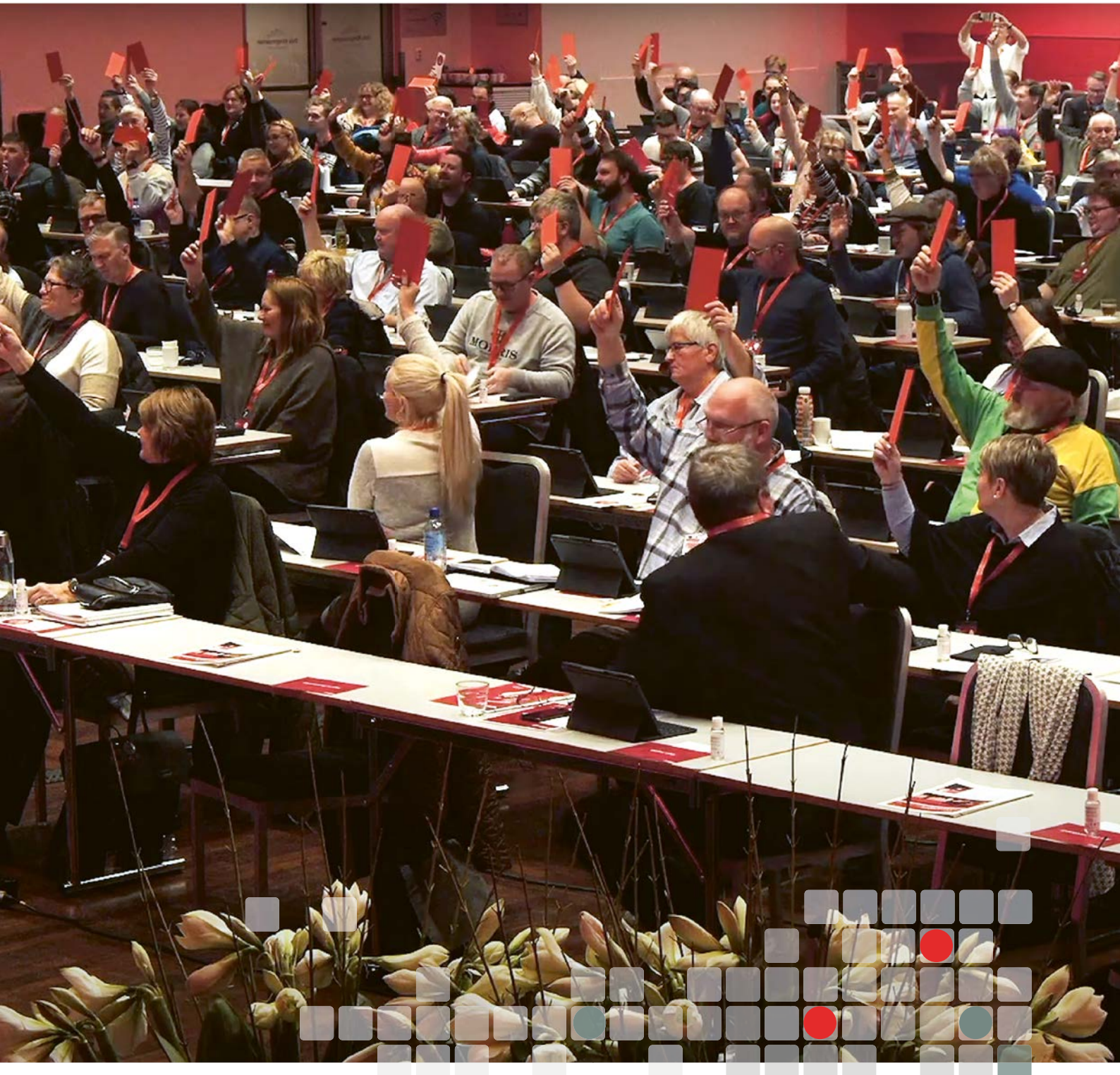
Avstemning på landsmøtet.