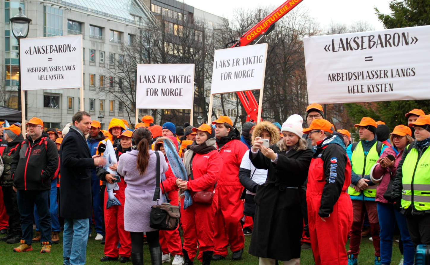
Lakeskatten satte sinnene i kok. Her fra markering foran Stortinget: «Kystbrølet».

ser, ble fornyet også i 2022. Norsk Mat står blant annet bak merkeordningen «Nyt Norge».