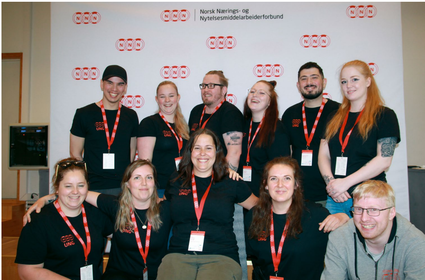
Nytt ungdomsutvalg, valgt på Ungdomskonferansen i juni 2022.

I perioden har DSU-lederen deltatt på møtene i forbundsstyret og landsstyret med tale- og forslagsrett. DSU-nestleder Løvstad Karlsen deltok som stedfortreder på forbundsstyremøtene i mars og mai 2022.