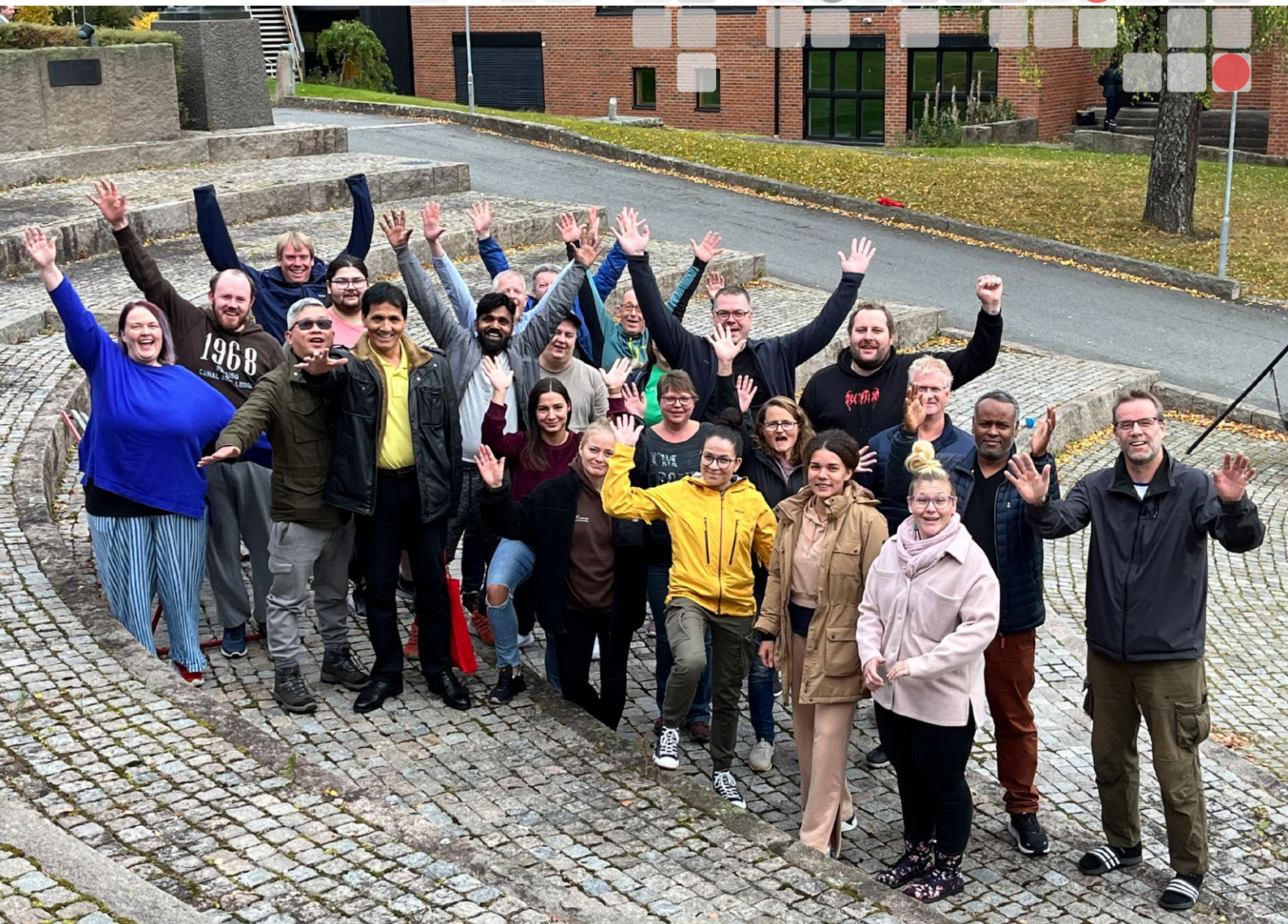
Glad kursgjeng på Sørmarka.