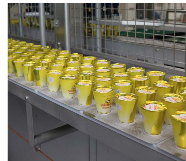
Produksjon av Krone-Is på Diplom-Is.

Mills Fredrikstad, som er den eneste bedriften, er en godt drevet klubb med stabile tillitsvalgte og medlemmer.