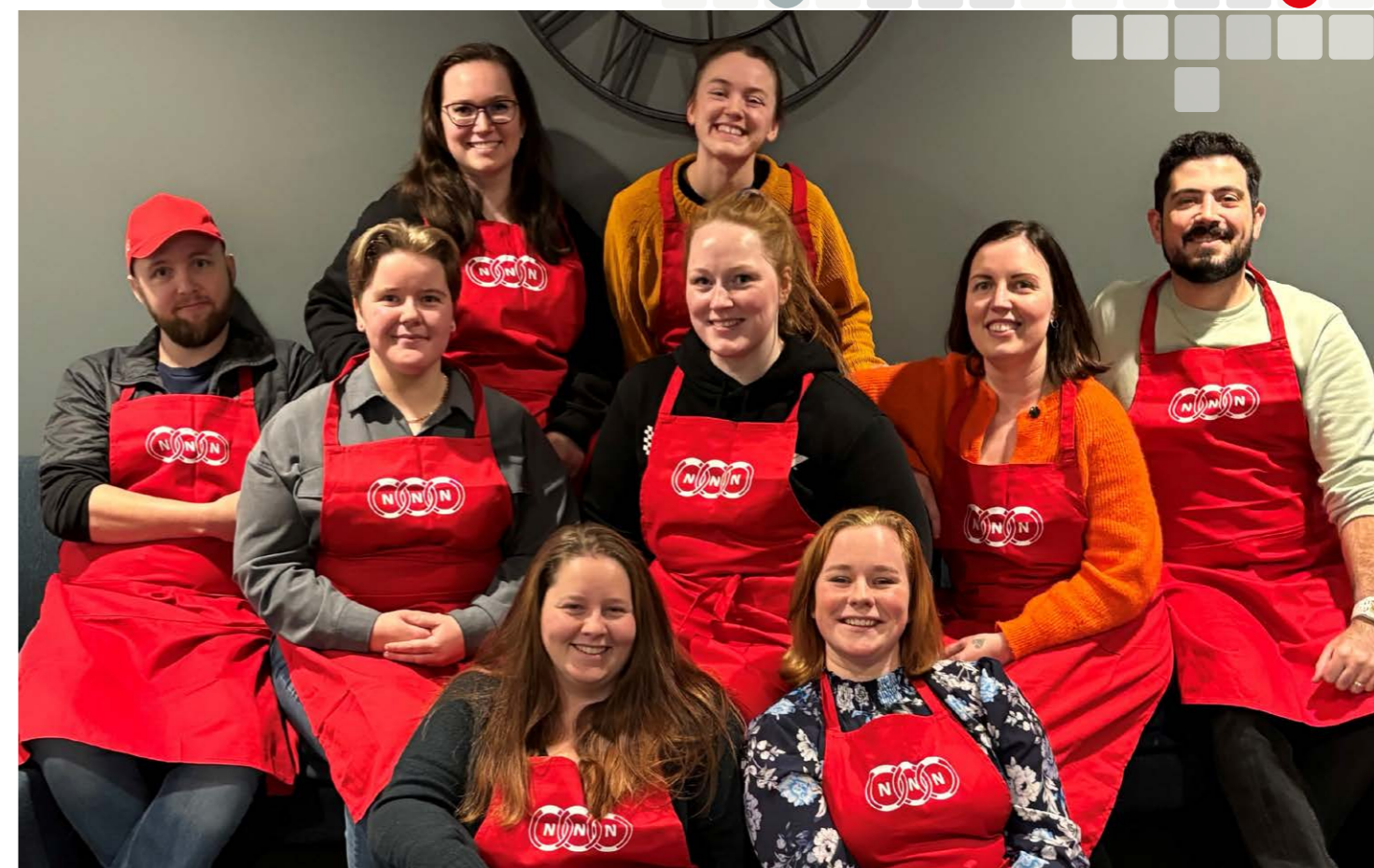
NNNs ungdomsutvalg (DSU).

DSU har vært representert og holdt innledning på alle forbundets Klubb- og avdelingslederkonferanser høsten 2024. I forbindelse med flere av konferansene har DSU samlet alle deltagerne under 35 år og snakket om lokalt ungdomsarbeid og fremtidig aktivitet for de unge.