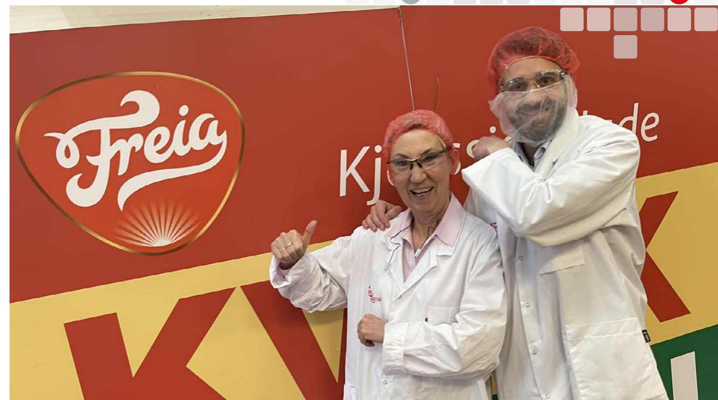
LO-leider Peggy Hessen Følsvik og Næringsminister Jan Christian Vestre besøker våre medlemmer på Freia (Mondelez).

Mat- og drikkevareindustrien er helt avhengig av gode, stabile og forutsigbare rammebetingelser for å kunne drive lønnsomt og tilby gode arbeidsplasser til forbundets medlemmer. Politisk arbeid med rammebetingelser har derfor vært høyt prioritert gjennom hele året. Vi har også et tett næringspolitisk samarbeid med andre forbund og interesseorganisasjoner i verdikjeden for norsk mat. Regjeringen har gjennom året jobbet med en egen Stortingsmelding om industri og et eget veikart for næringsmiddelindustrien. Forbundet har både gitt skriftlige innspill og deltatt på møter om dette. Vi har også bidratt med innspill til en Stortingsmelding om beredskap og hatt oppslag i media om det.