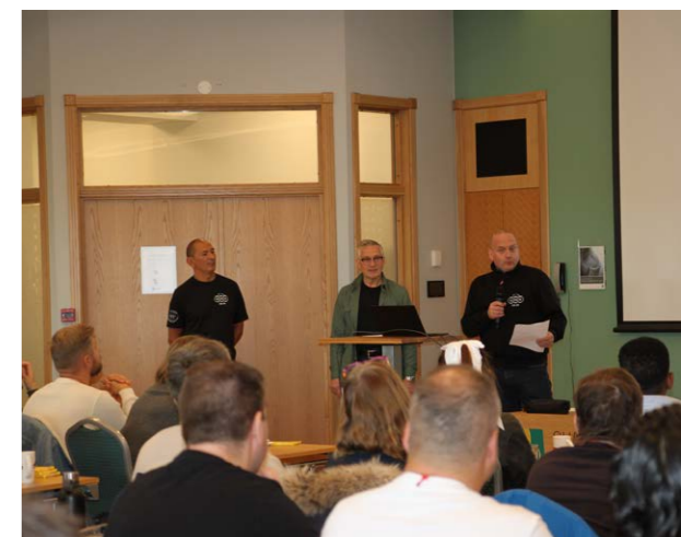
Klubb- og avdelingslederkonferanse, Oslo og Akershus.

Aktuelle tema har vært forbundets egen organisasjon med fokus på organisasjonsteamet og avdelingene, samt næringspolitikk, fagligpolitisk samarbeid og Stortingsvalget 2025.